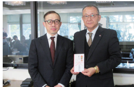
日本競輪選手会福岡支部久留米事務所様(野中町)