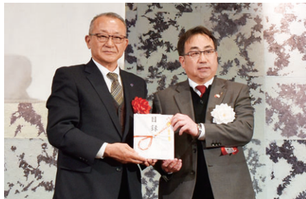
久留米中央ロータリークラブ様(城南町)