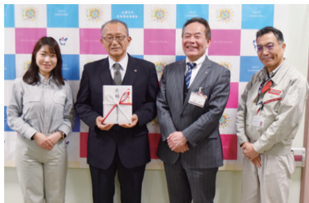
(株)ブリヂストン様(京町)