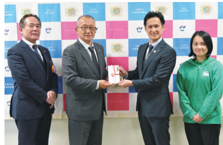
(株)未来ケアグループ様(神崎市)