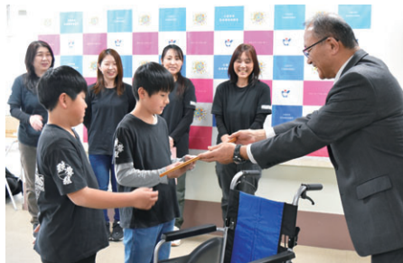
御井鼓舞組様(御井町)