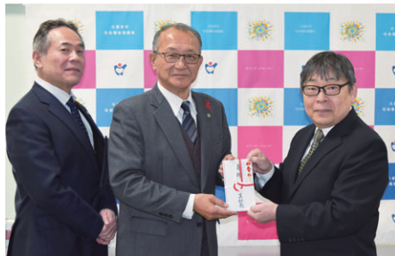
真如苑久留米様(野中町)