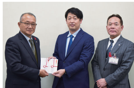
フリーランスプランニング(株)様(篠山町)