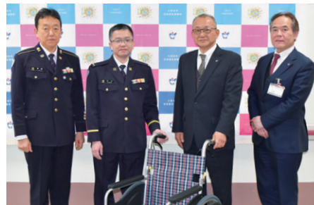
前川原駐屯地 曹友会様(高良内町)