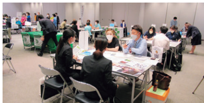
フェア会場内の様子