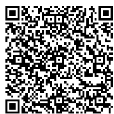
市社協 ホームページ

—— 問い合わせ —— 市社会福祉協議会・生活支援課 TEL0942・34・3035 FAX0942・34・3090