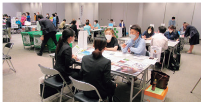
フェア会場内の様子