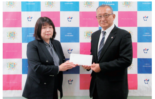
左: 日産自動車九州株式会社様

日産自動車九州株式会社様から、災害ボランティアセンターの運営資金としてご寄付をいただきました。あたたかいお気持ち誠にありがとうございました。